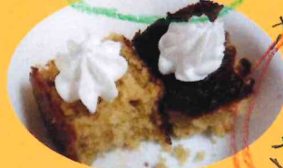
おたけ のせし さめりいおれ