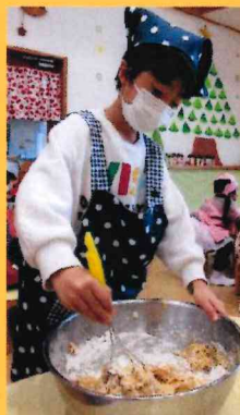
ほめの子の まじらない...