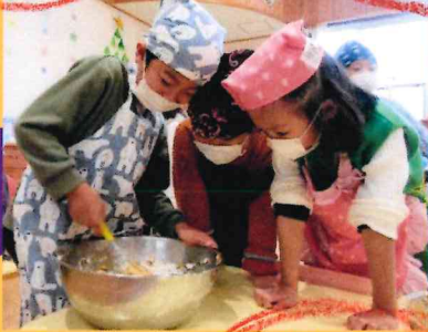
小麦粉と卵を 混ぜて〜